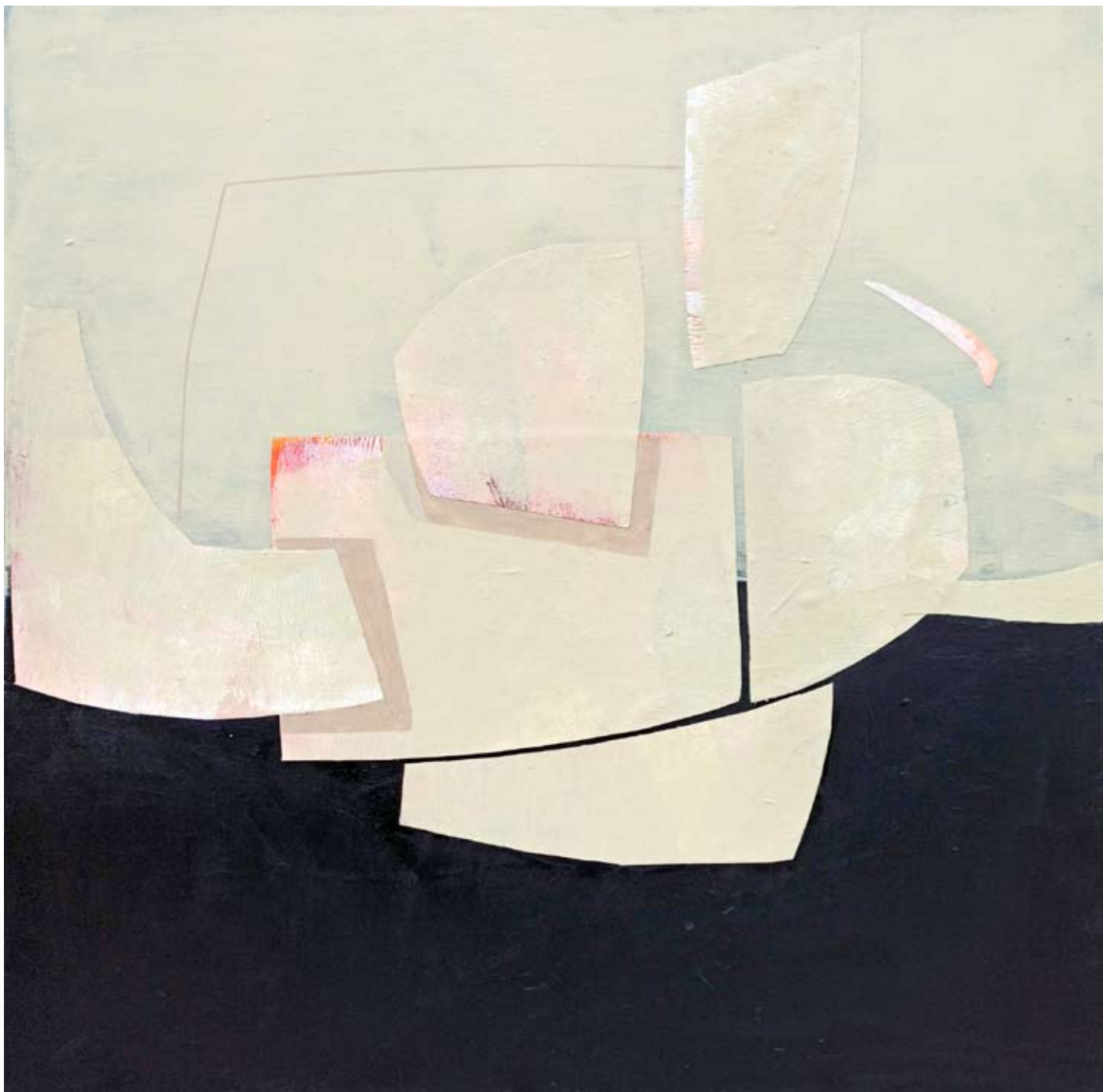
"Kotysanie" 2023 acrylic on canvas 90/90 cm 5200 pln