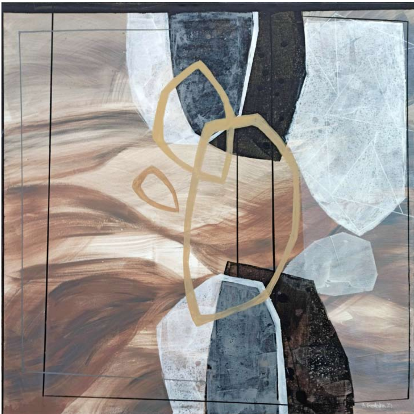
"River Stones 2" 2023 acrylic on canvas 90/90 cm 5200 pln