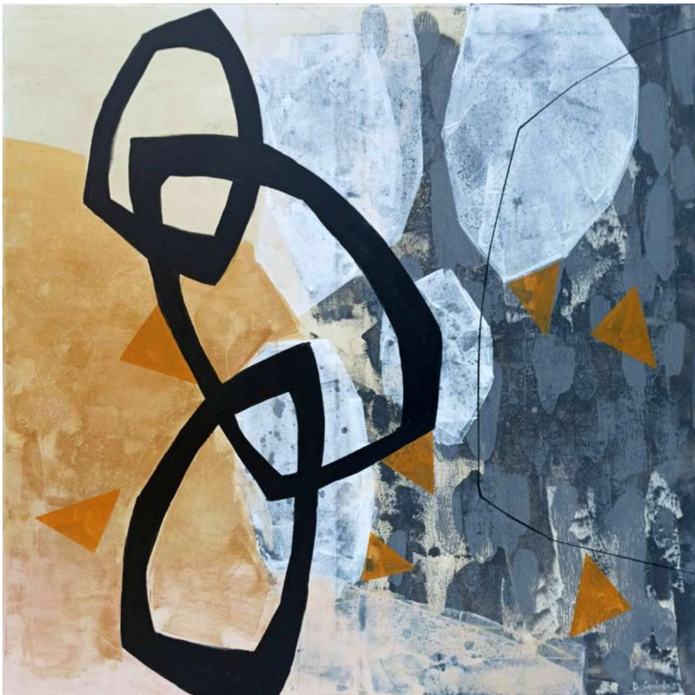
"Silent Steps" 2023 acrylic on canvas 100/100 cm 5500 pln

https://napiorkowska.pl/anna-masiul-gozdecka/