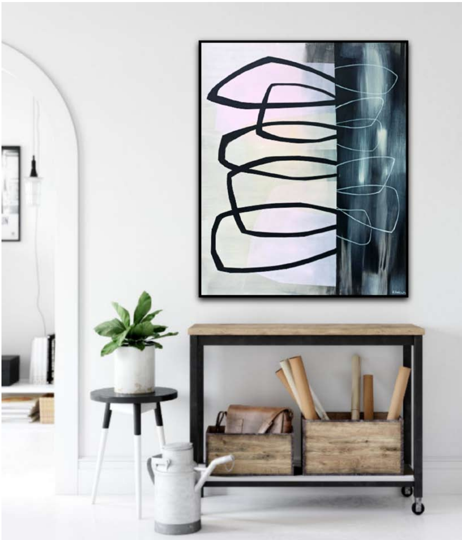
"Reshape 1" 2023 acrylic on canvas 120/100 cm 6500 pln