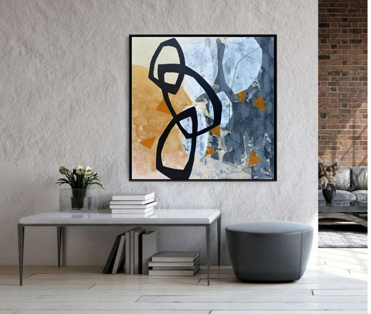
"Silent Steps" 2023 acrylic on canvas 100/100 cm 5500 pln