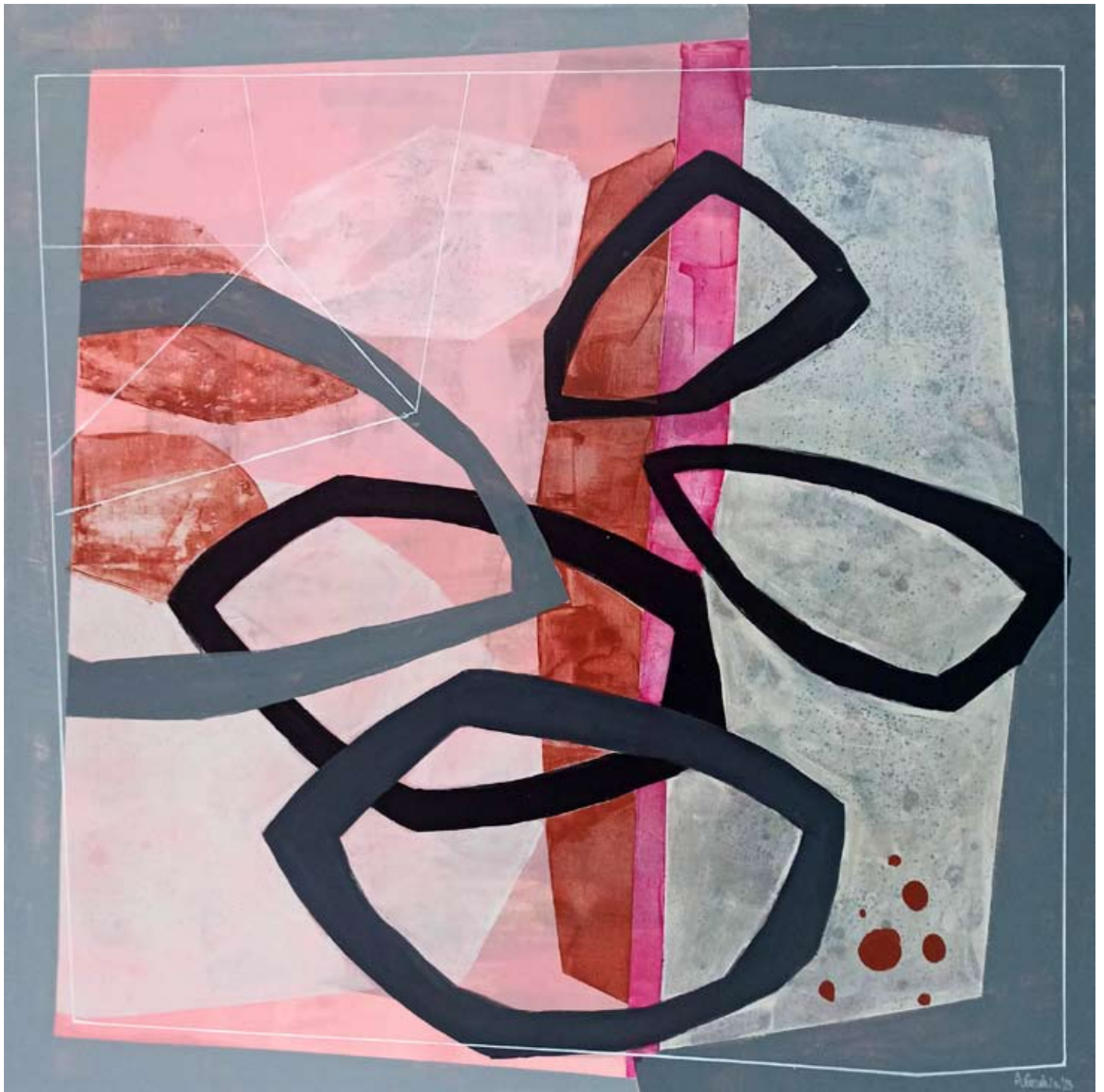
"Crisp Morning" 2023 acrylic on canvas 100/100 cm 5500 pln

https://napiorkowska.pl/anna-masiul-gozdecka/