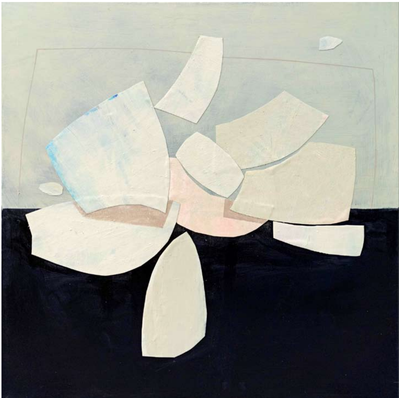
"Rozkwitanie" 2023 acrylic on canvas 90/90 cm 5200 pln

https://napiorkowska.pl/anna-masiul-gozdecka/