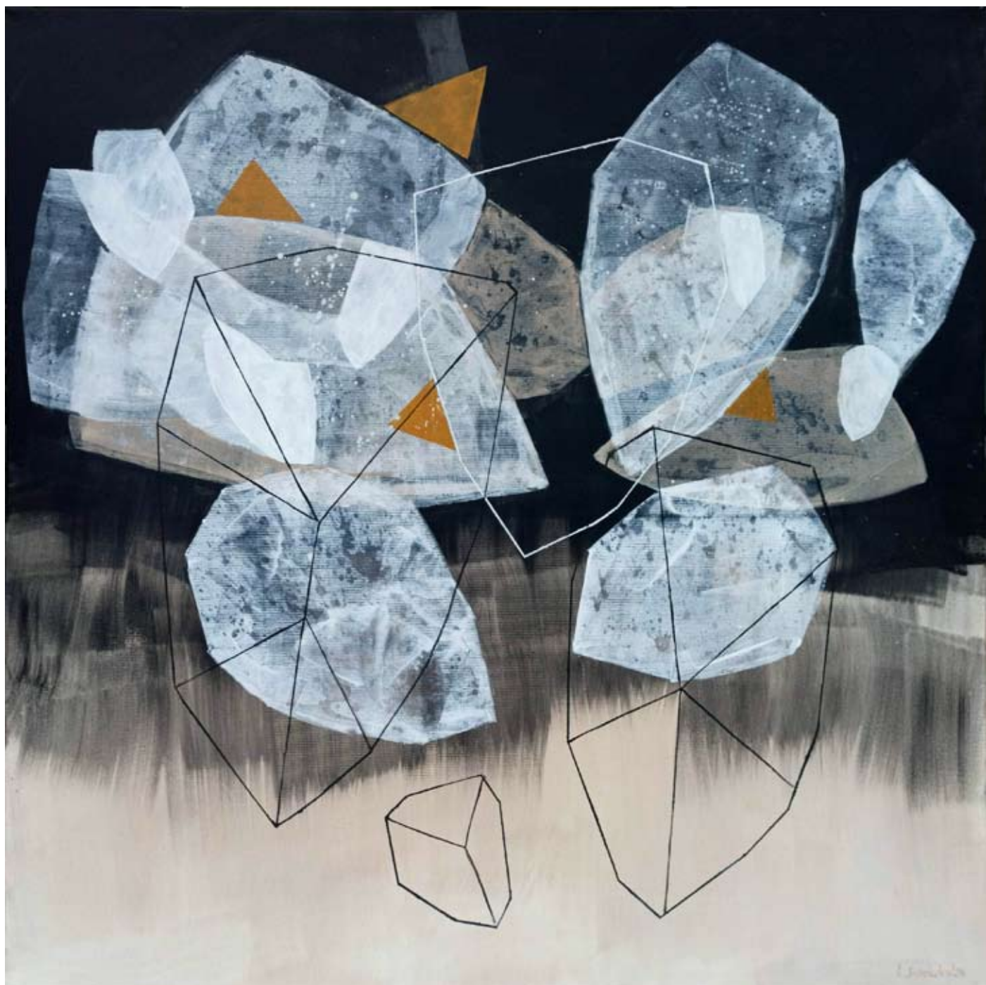
"Night So Clear" 2023 acrylic on canvas 100/100 cm 5500 pln