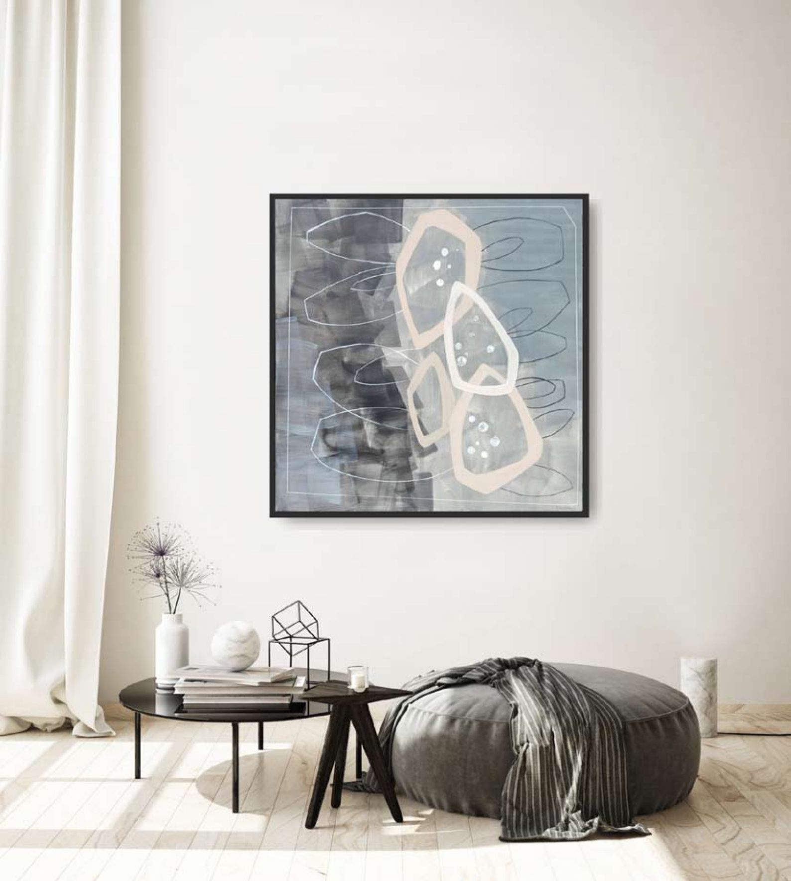
"Sleeping 1" 2023 acrylic on canvas 100/100 cm 5500 pln