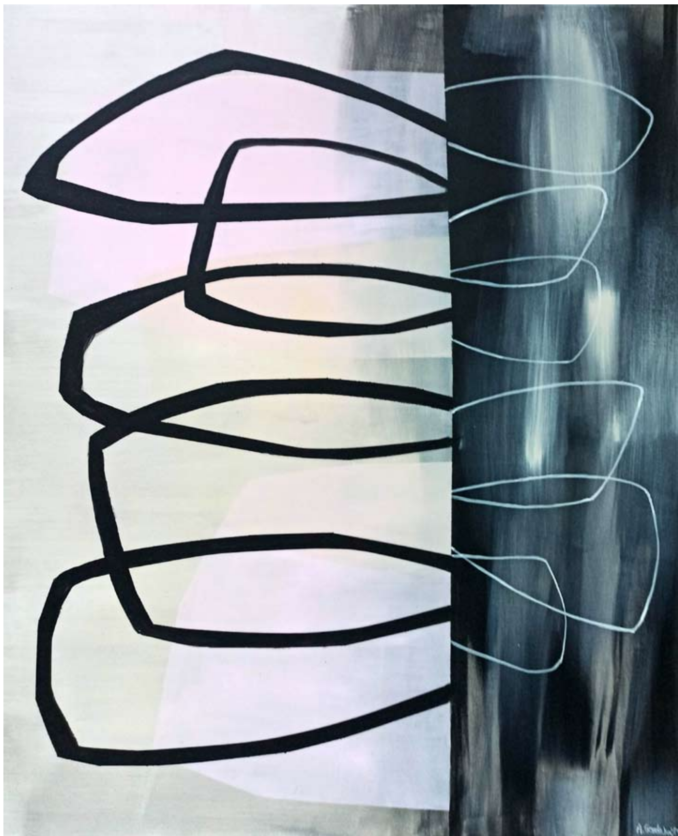
"Reshape 1" 2023 acrylic on canvas 120/100 cm 6500 pln