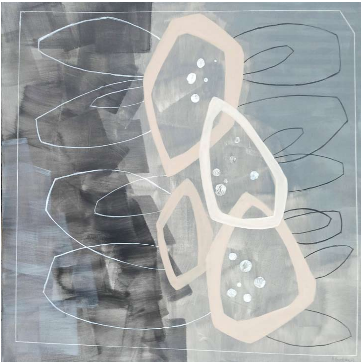
"Night So Clear" 2023 acrylic on canvas 100/100 cm 5500 pln