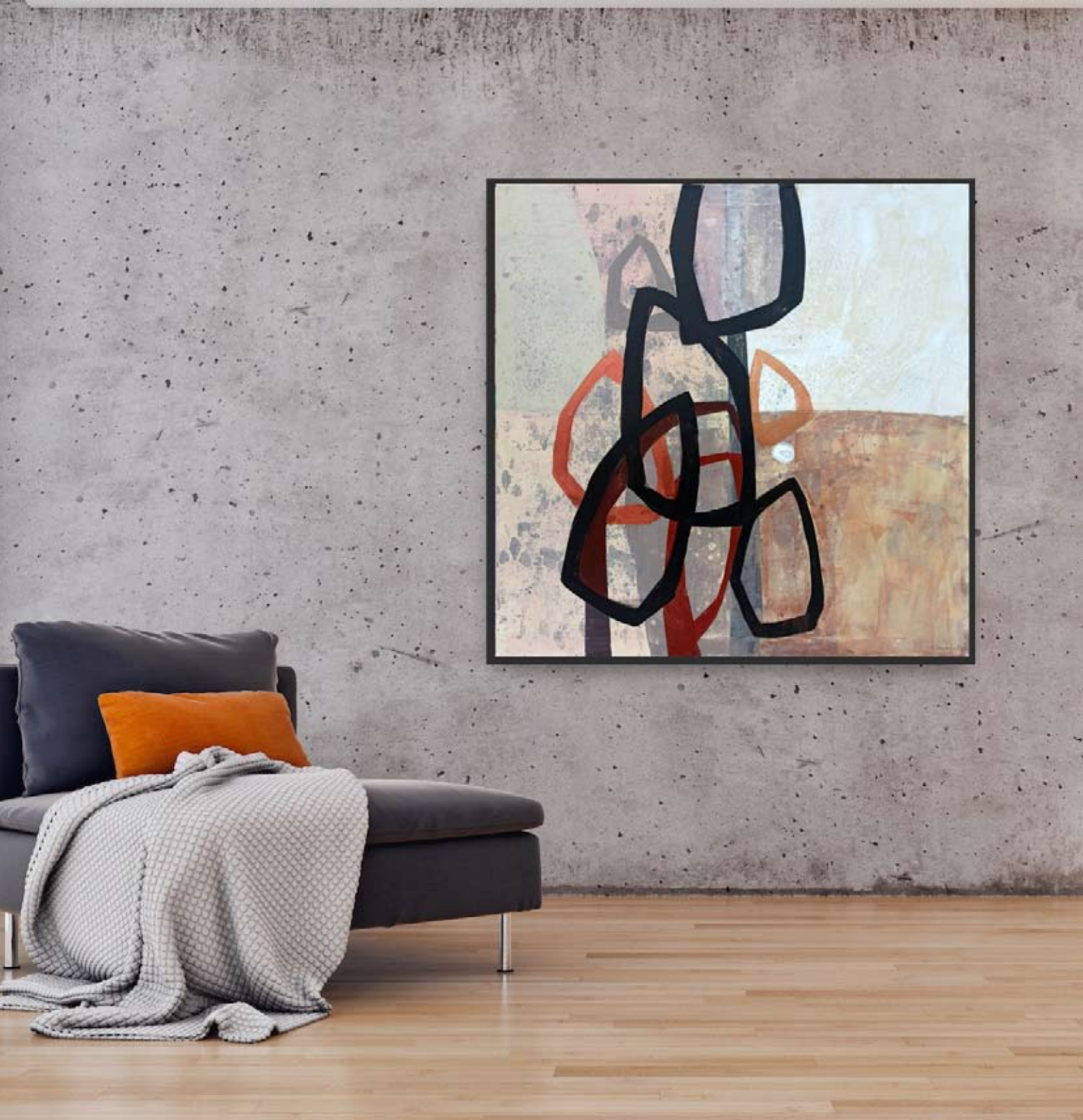
"Autumn Garden" 2023 acrylic on canvas 100/100 cm 5500 pln