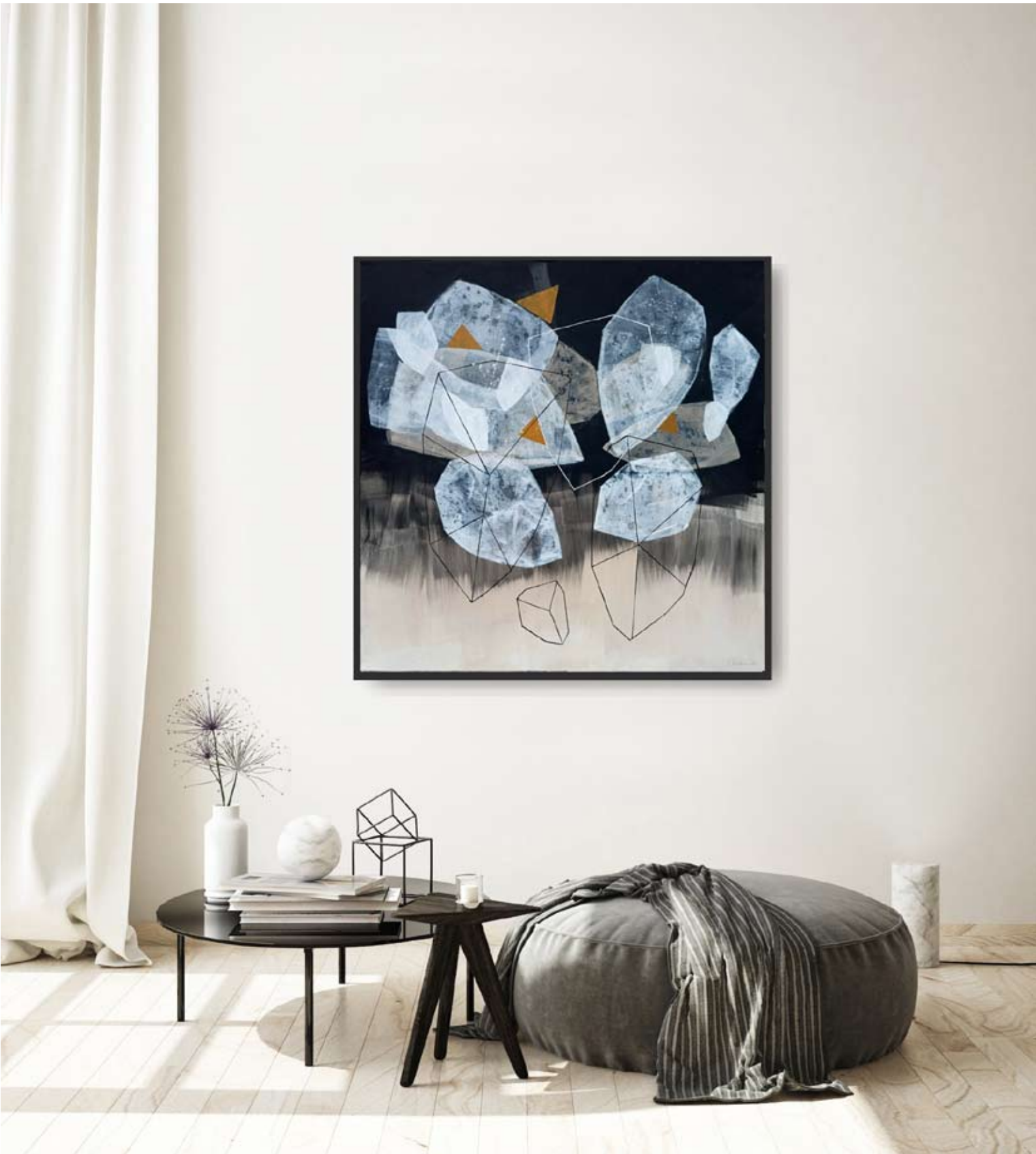
"Night So Clear" 2023 acrylic on canvas 100/100 cm 5500 pln