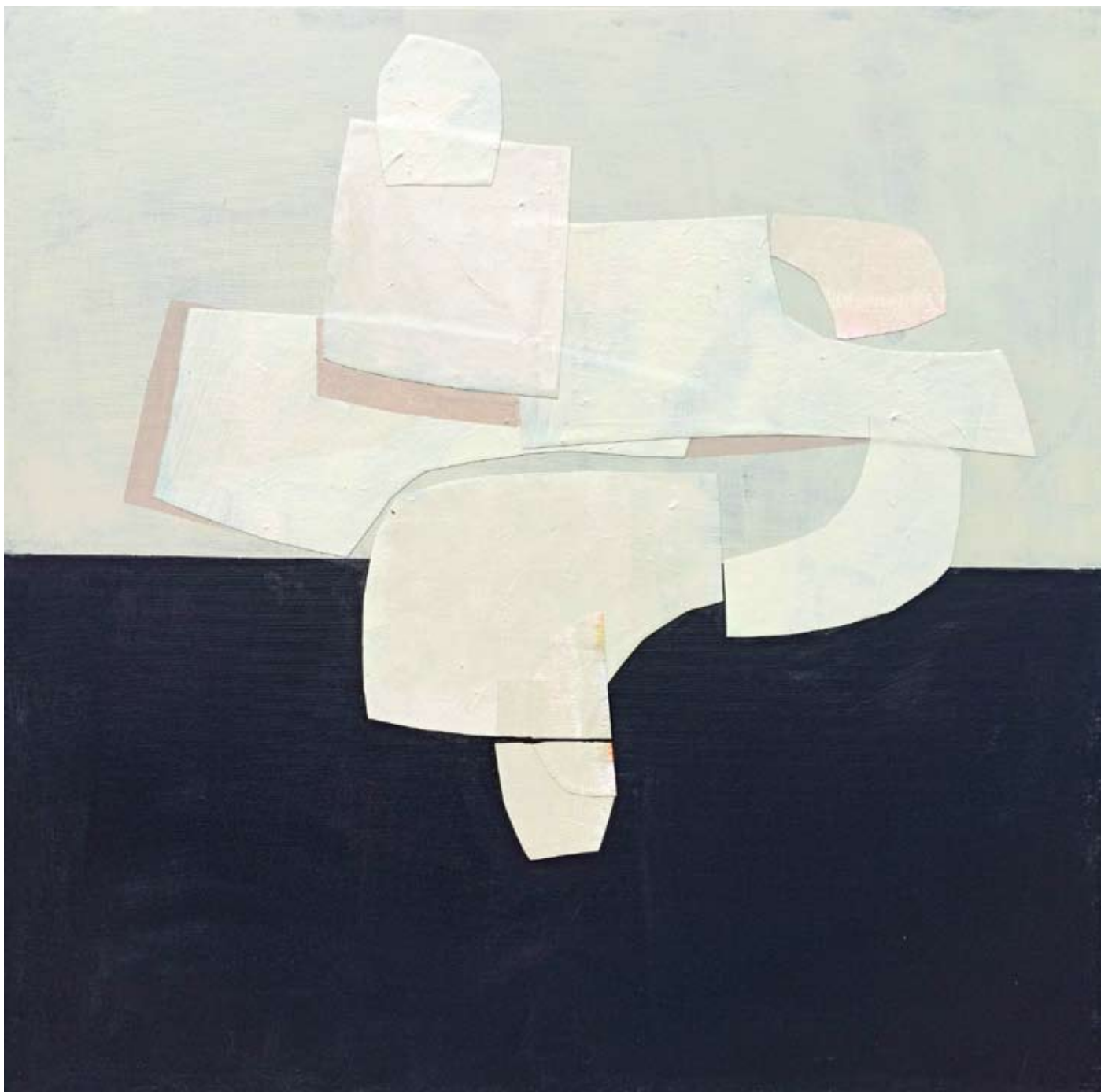
"Równowaga" 2023 acrylic on canvas 90/90 cm 5200 pln