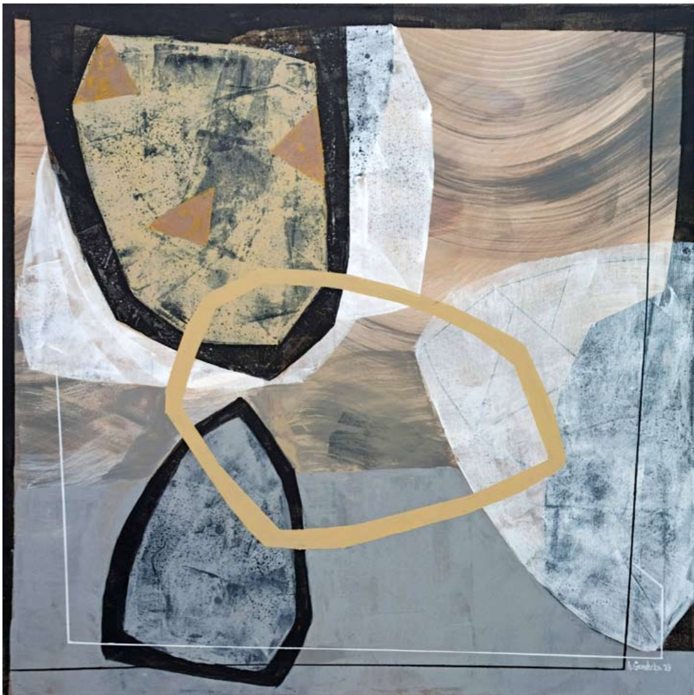
"River Stones 1" 2023 acrylic on canvas 90/90 cm 5200 pln