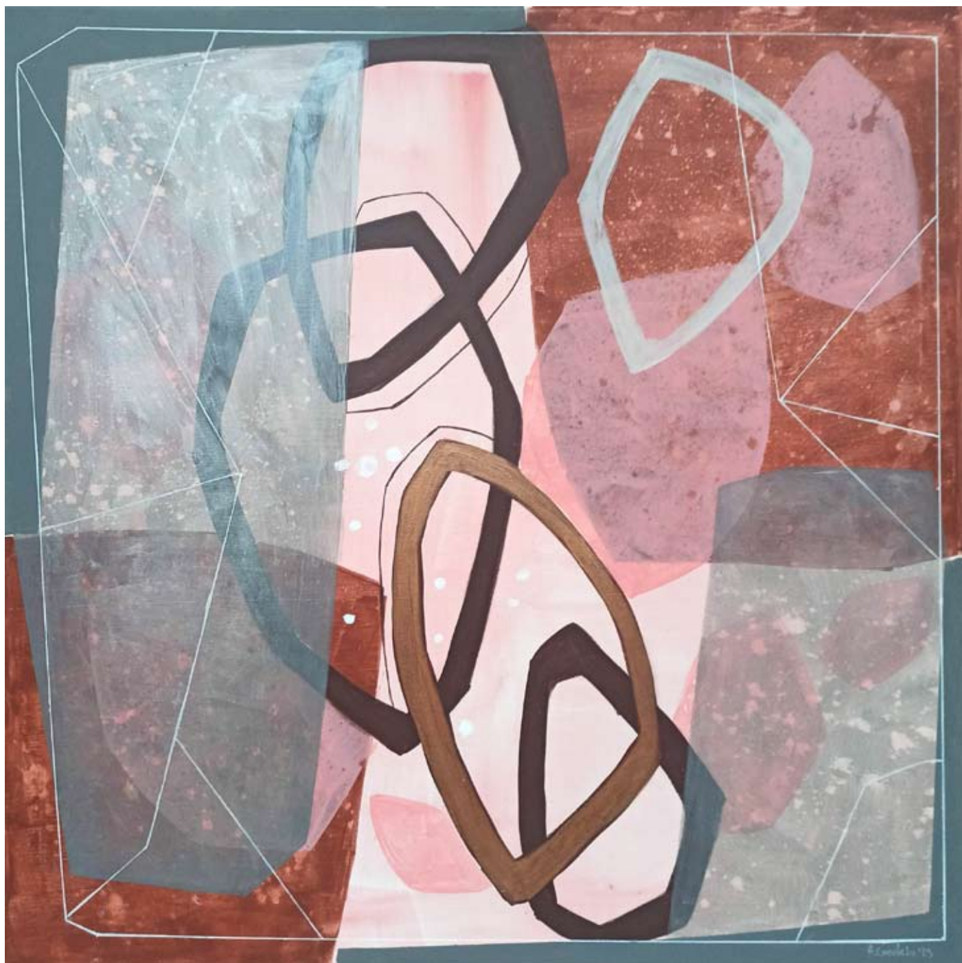
"Crisp Morning 2" 2023 acrylic on canvas 100/100 cm 5500 pln