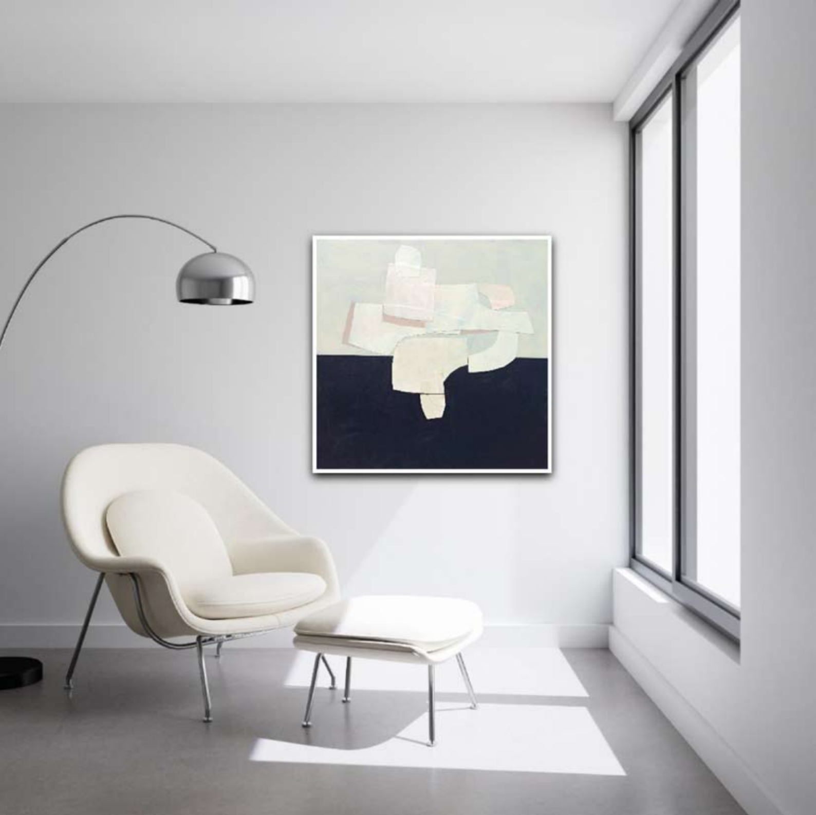
"Równowaga" 2023 acrylic on canvas 90/90 cm 5200 pln