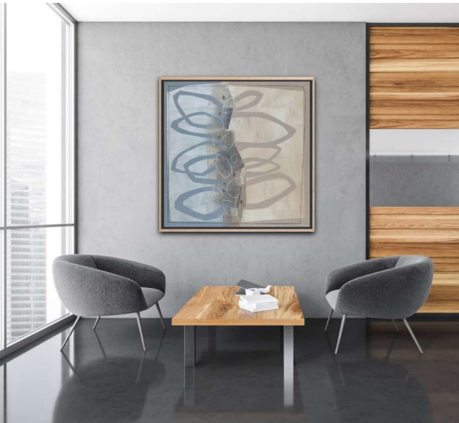
"Sleeping 2" 2023 acrylic on canvas 100/100 cm 5500 pln