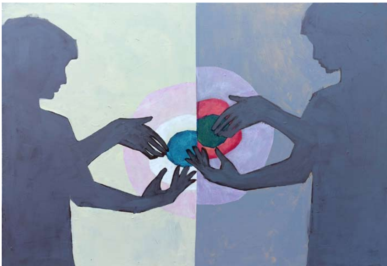
"Alchemik" 2023 acrylic on canvas 70/100 cm 6500 pln