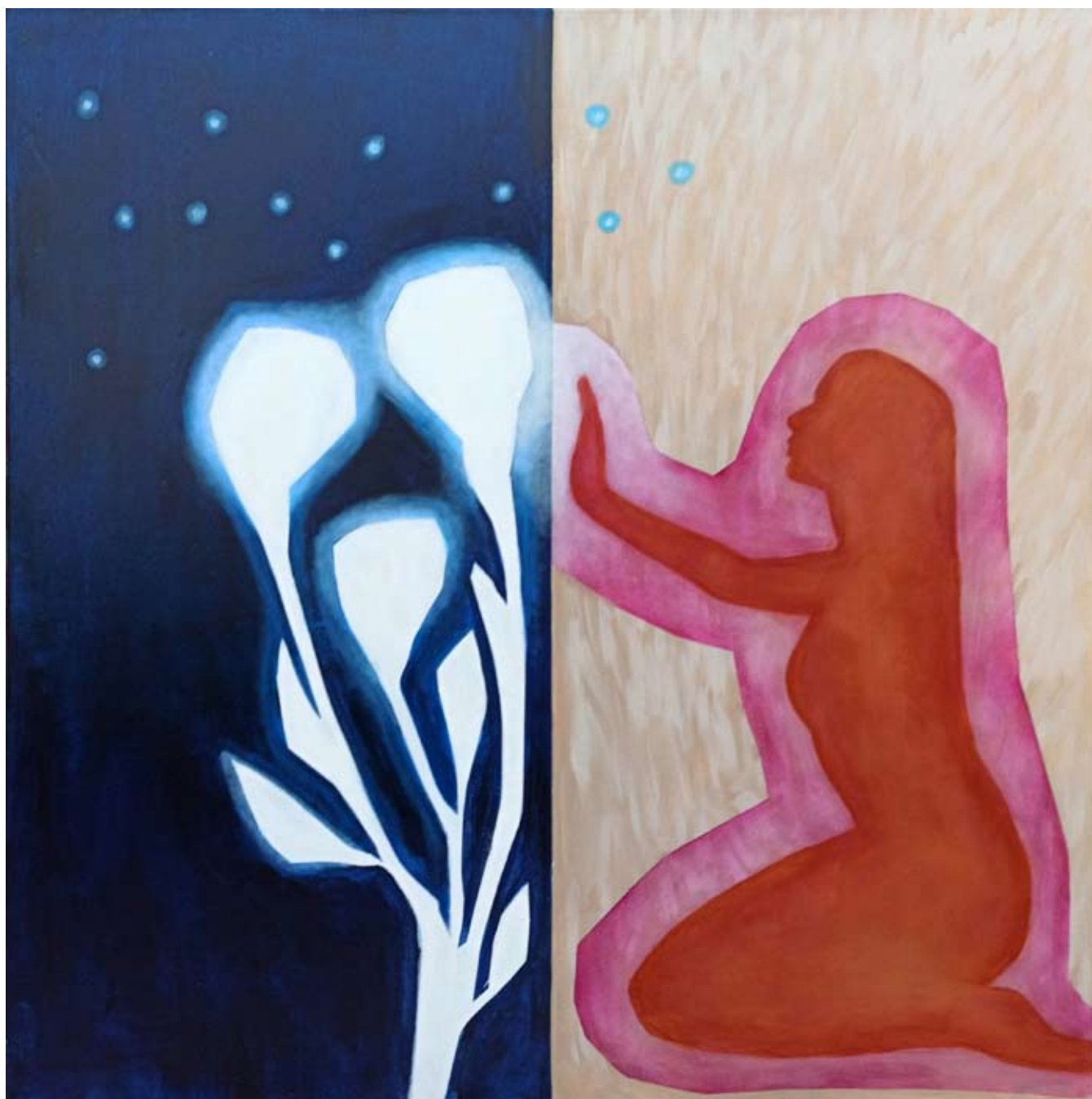
"Chłonek 1" 2023 acrylic on canvas 100/100 cm 40/40 in 5500 pln