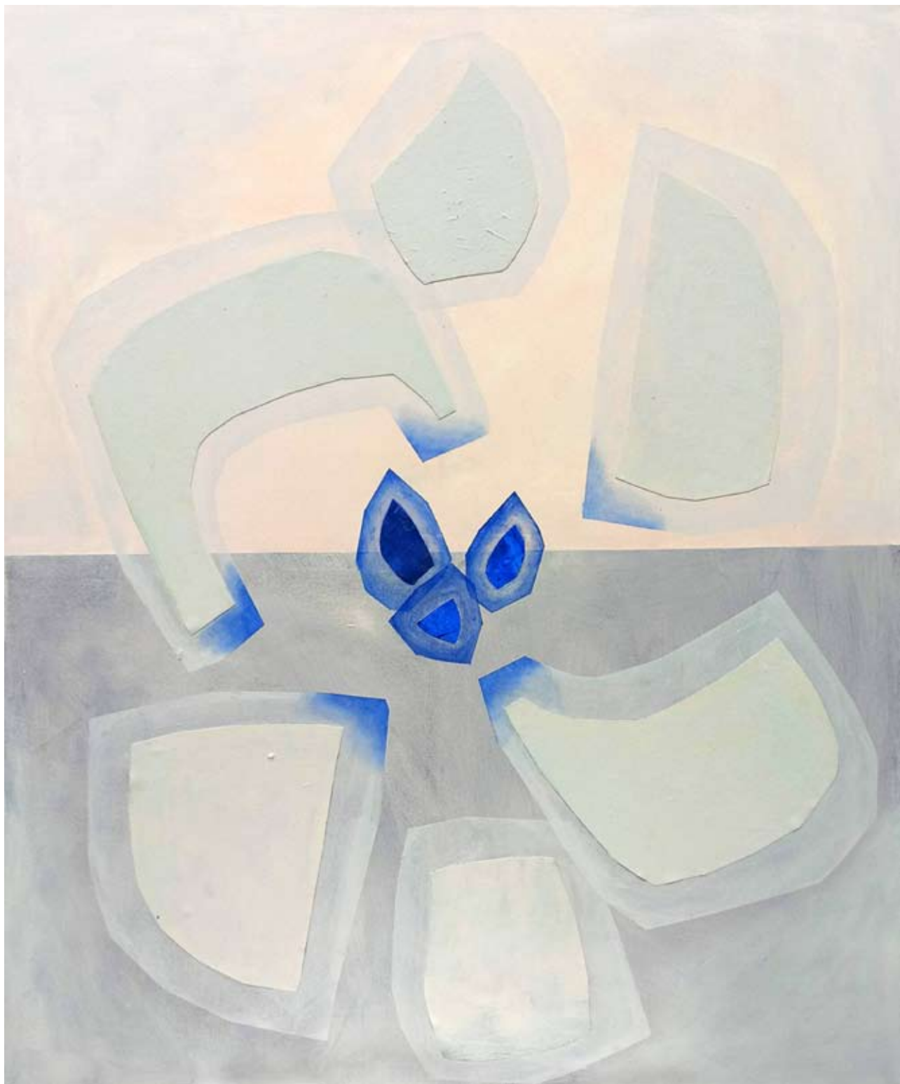
"Przenikania" 2023 acrylic on canvas 120/100 cm 48/40in 6500 pln