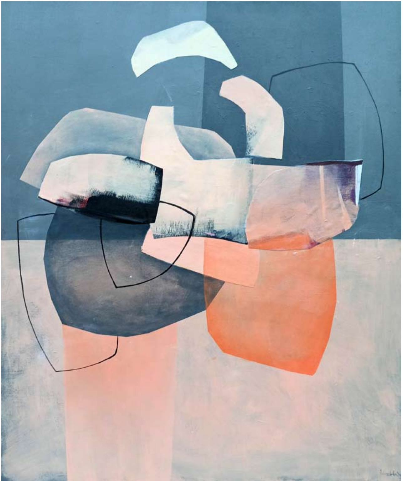
"Nadchodzi jesień" 2023 acrylic on canvas 120/100 cm 48/40 in 6500 pln