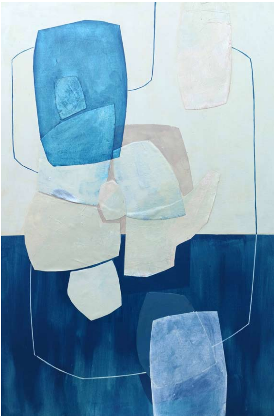
"Dary " 2023 acrylic on canvas, collage 120/80 cm 48/31,5 in 5500 pln