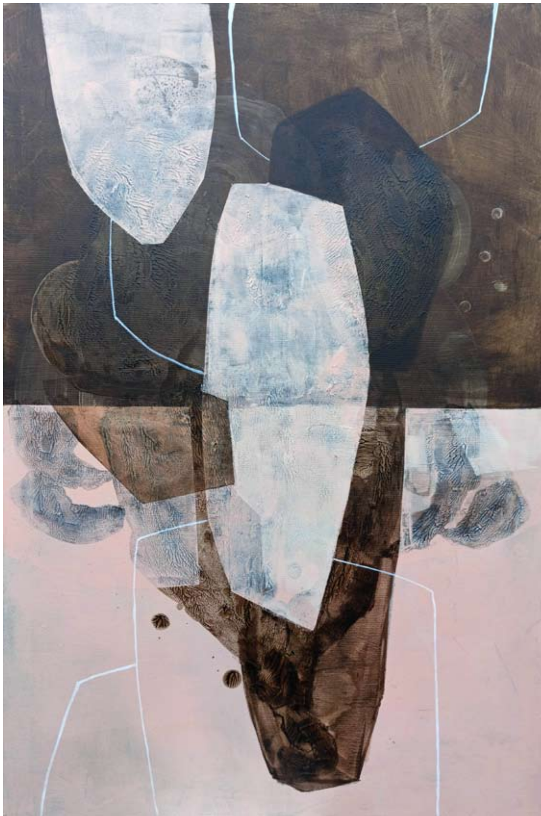
"Korzenie" 2023 acrylic on canvas, collage 120/80 cm 48/31,5 in 5500 pln