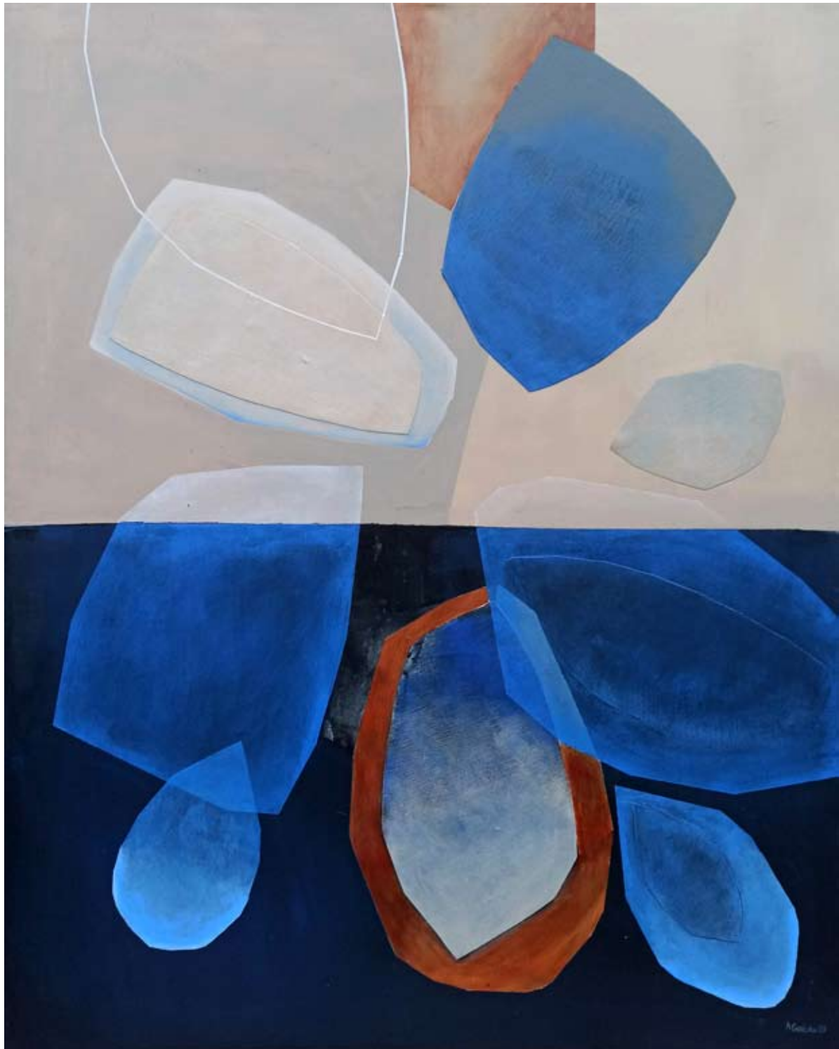
"Emanacje 5" 2023 acrylic on canvas, collage 100/80 cm 40/31,5 in 5000 pln