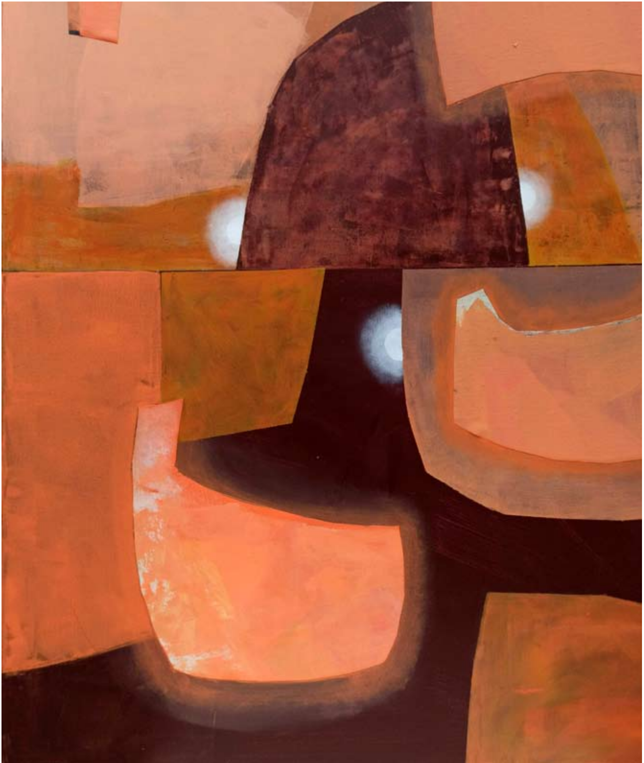
"Przejścia" 2023 acrylic on canvas 120/100 cm 48/40 in 6500 pln