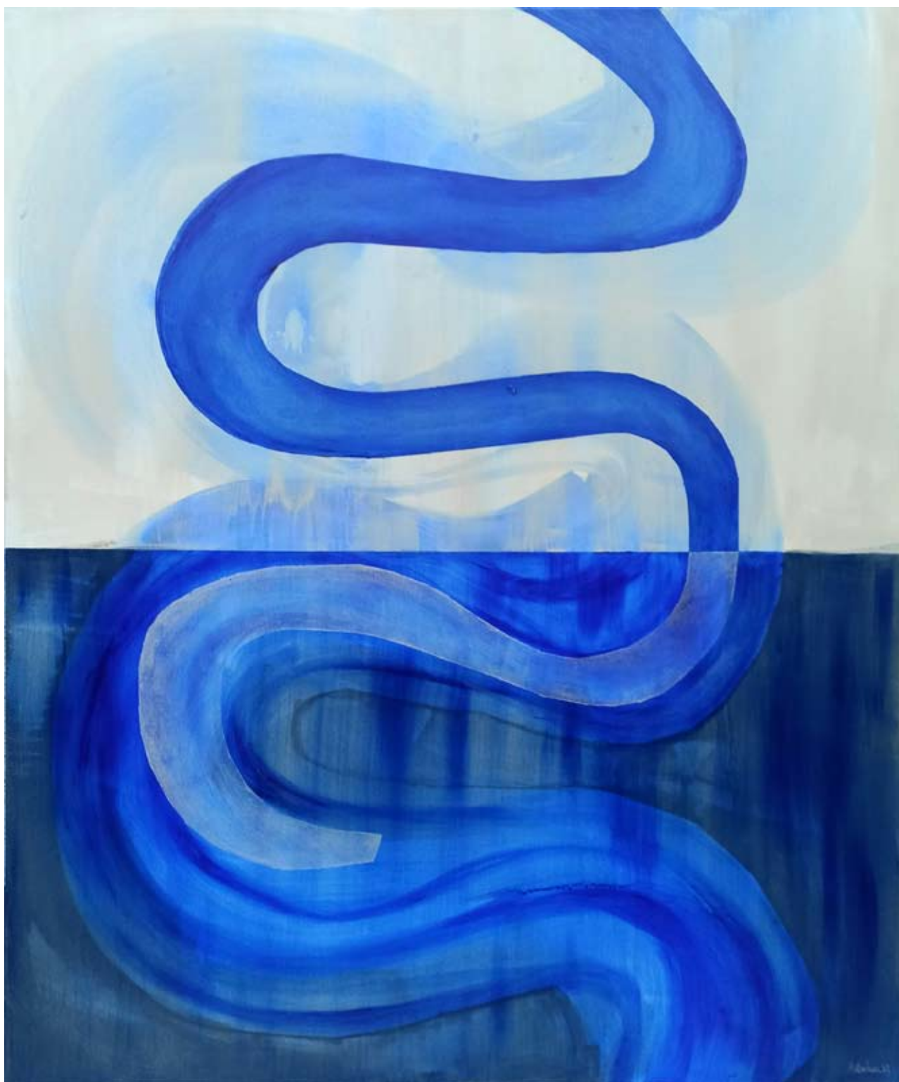
"Rzeka" 2023 acrylic on canvas 120/100 cm 48/40 in 6500 pln