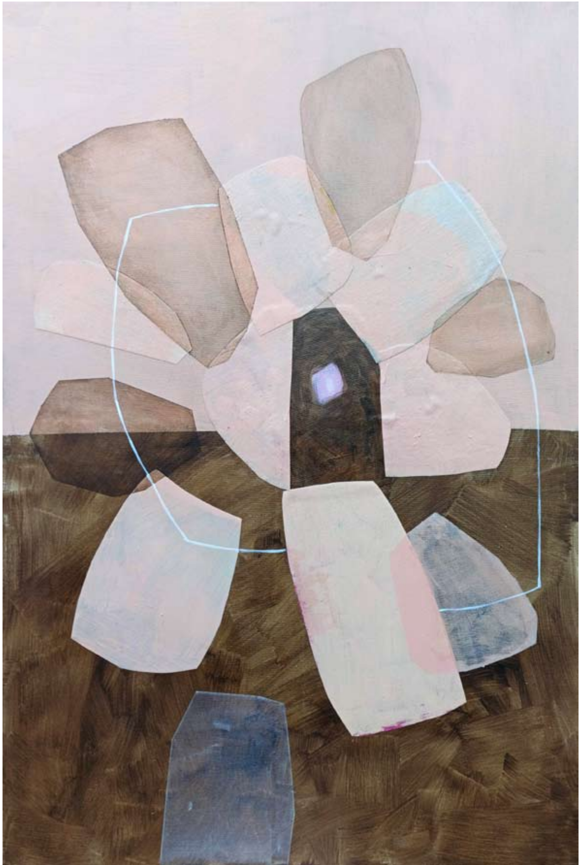
"Zaistnienie" 2023 acrylic on canvas, collage 120/80 cm 48/31,5 in 5500 pln