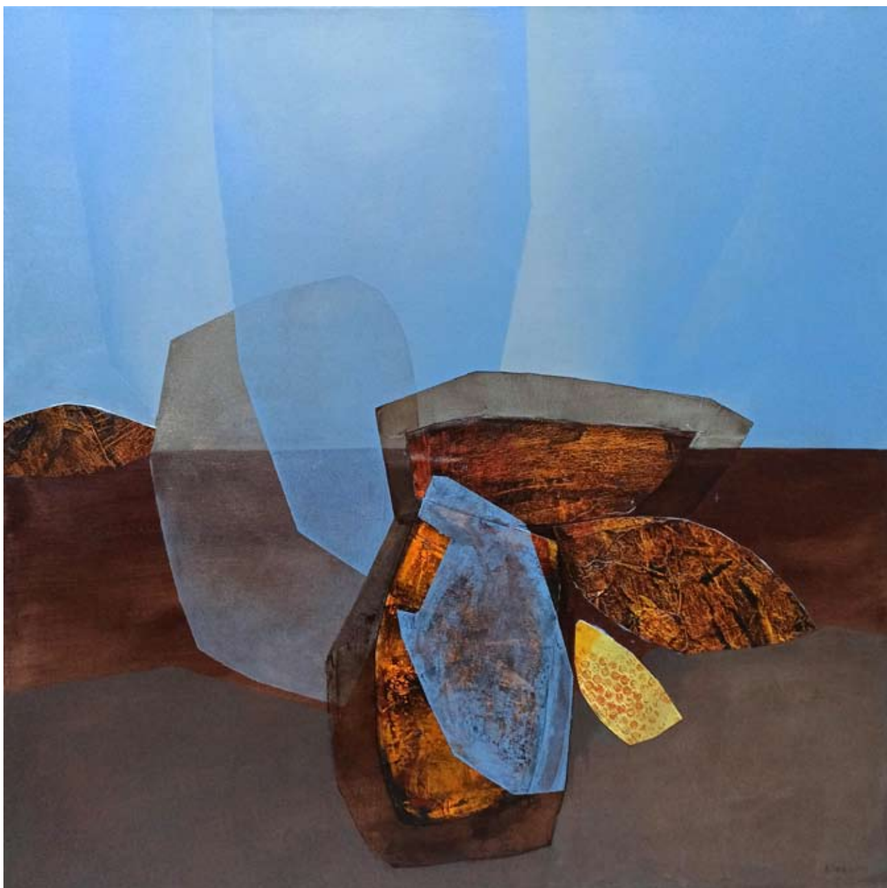
"Źródło" 2023 acrylic on canvas 100/100 cm 40/40 in 5500 pln