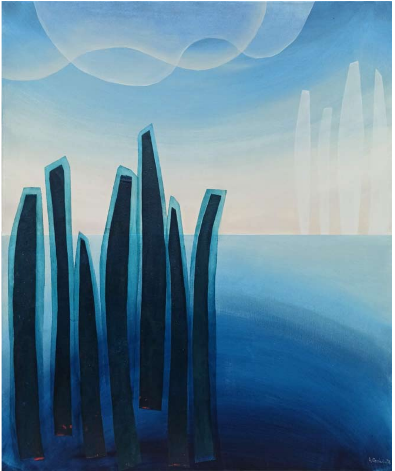
"Jezioro" 2023 acrylic on canvas 120/100 cm 48/40 in 6500 pln