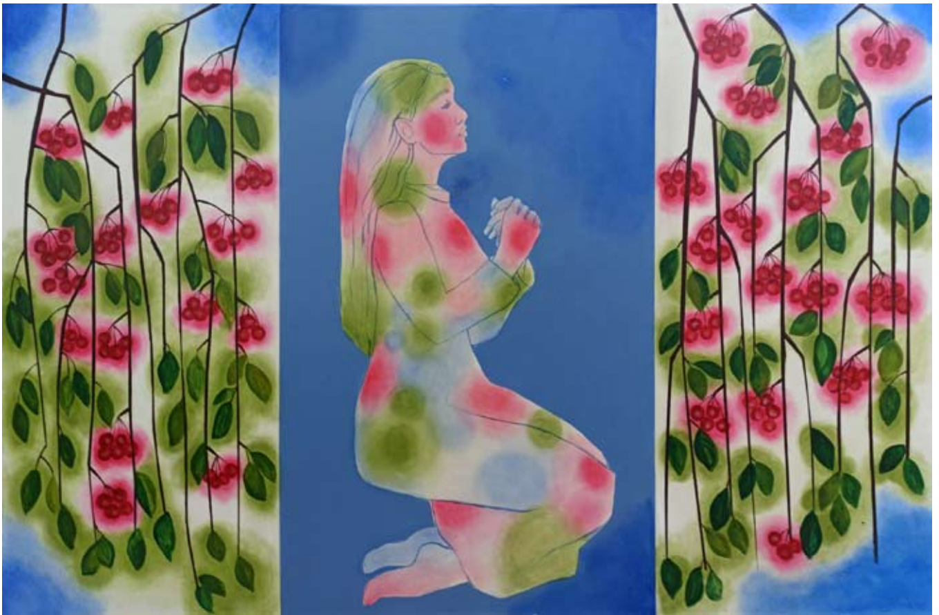
"Chłonięcie 2" 2023 acrylic on canvas 100/1500 cm 40/59 in 8500 pln