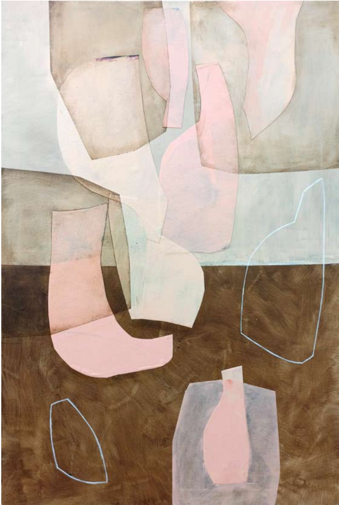
"Zapachy " 2023 acrylic on canvas, collage 120/80 cm 48/31,5 in 5500 pln