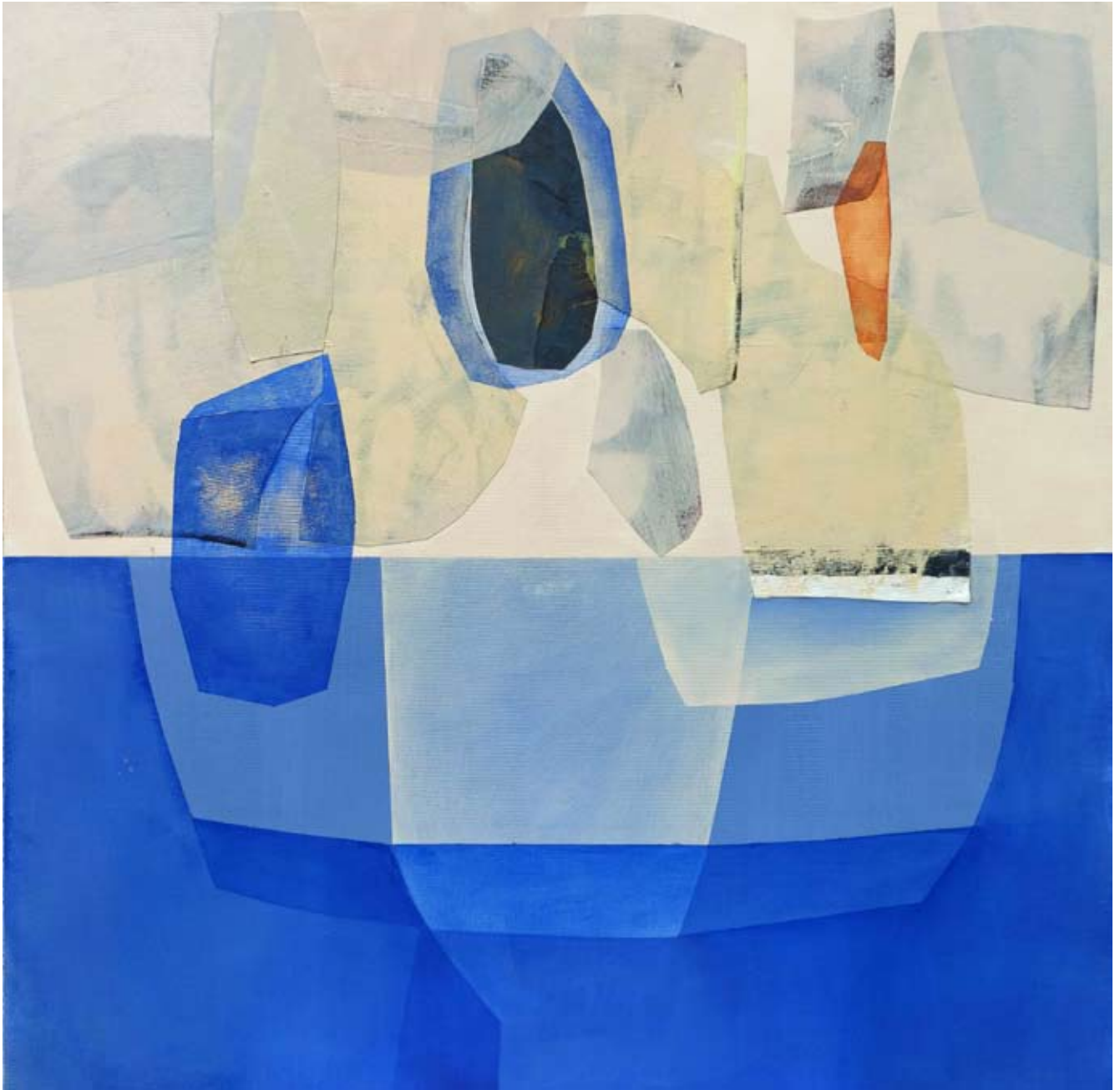
"Kryształy" 2023 acrylic on canvas 100/100 cm 40/40 in 5500 pln