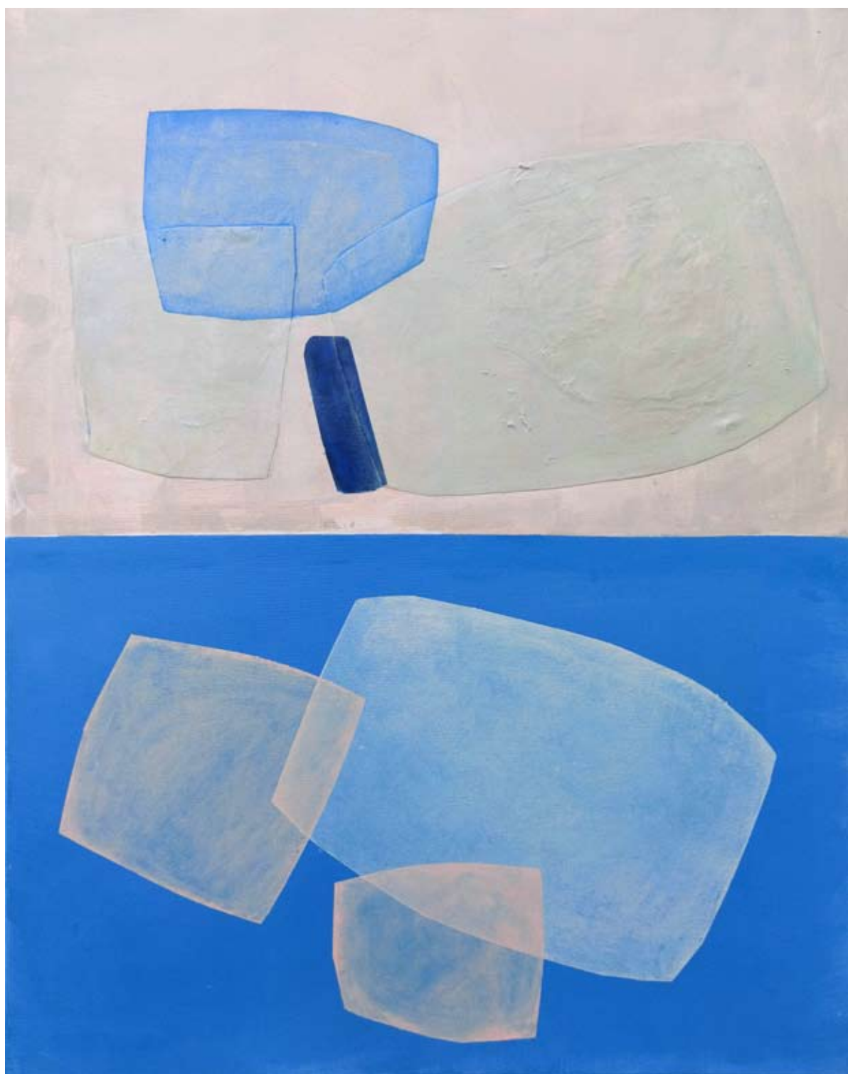
"Emanacje 2" 2023 acrylic on canvas, collage 100/80 cm 40/31,5 in 5000 pln