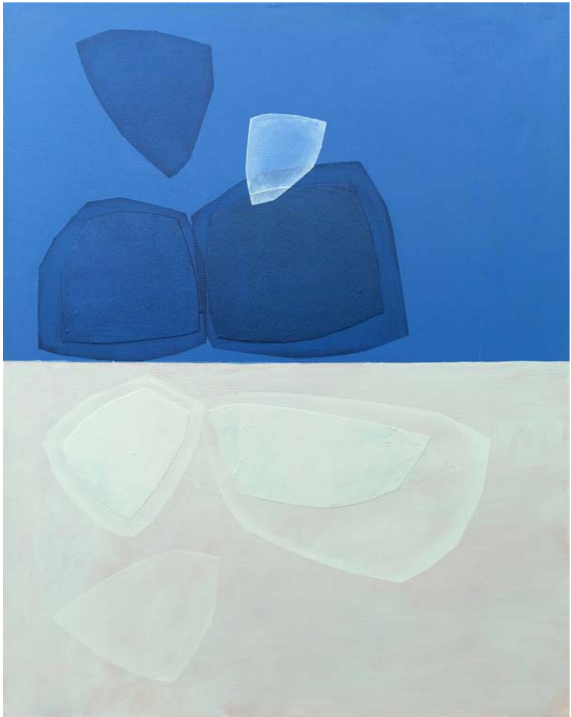
"Emanacje 1" 2023 acrylic on canvas, collage 100/80 cm 40/31,5 in 5000 pln