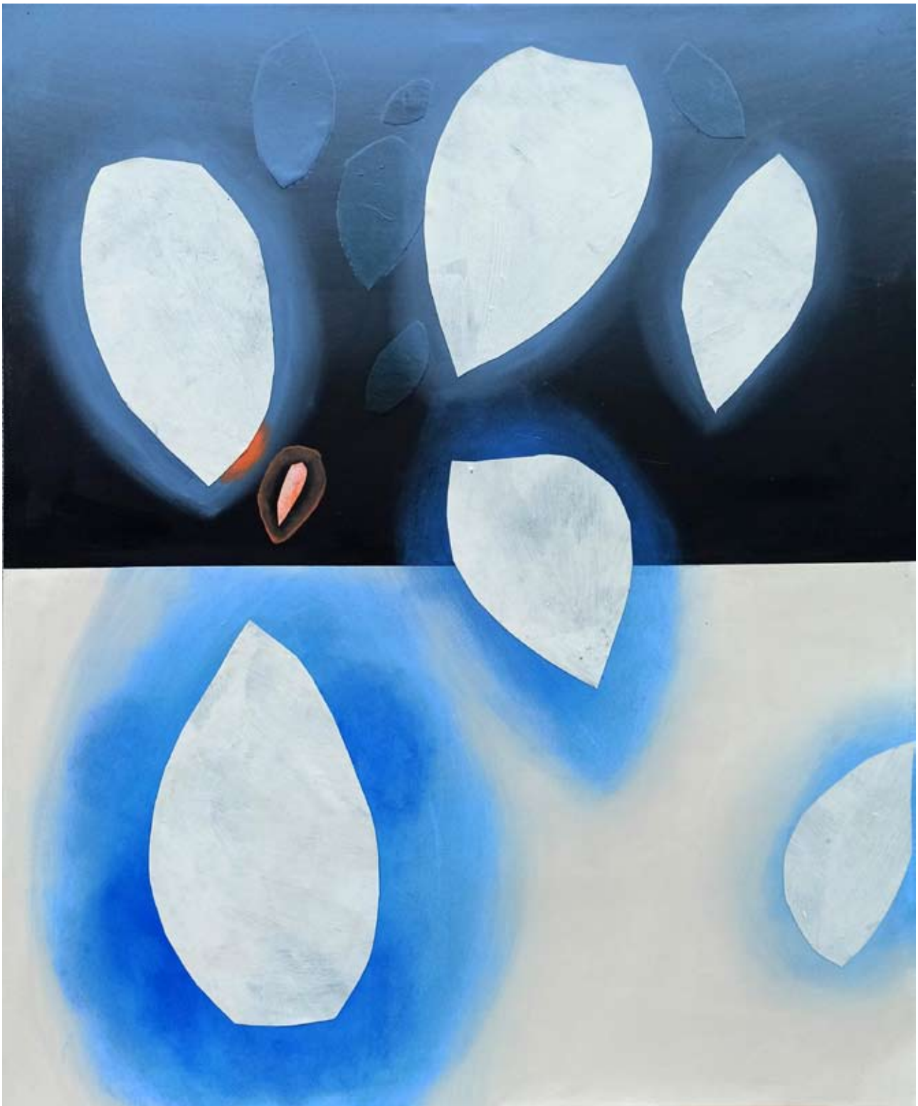
"Nocny Ogród" 2023 acrylic on canvas 120/100 cm 48/40 in 6500 pln