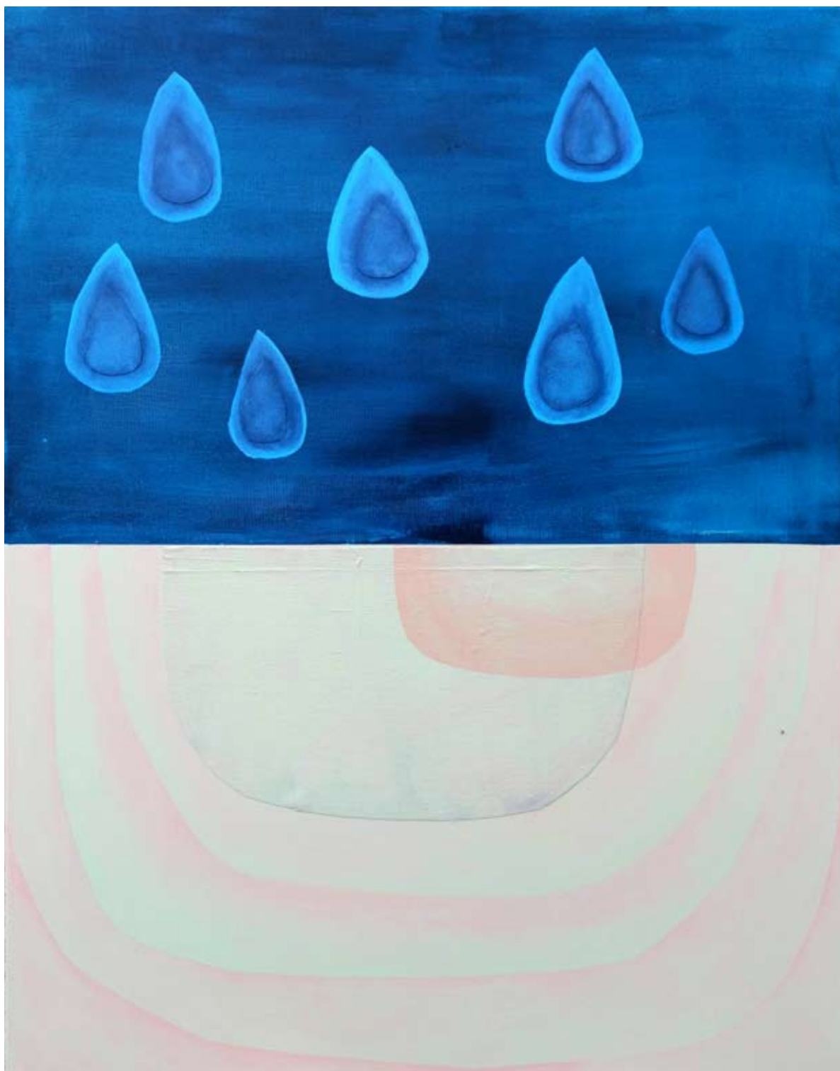
"Emanacje 3" 2023 acrylic on canvas, collage 100/80 cm 40/31,5 in 5000 pln