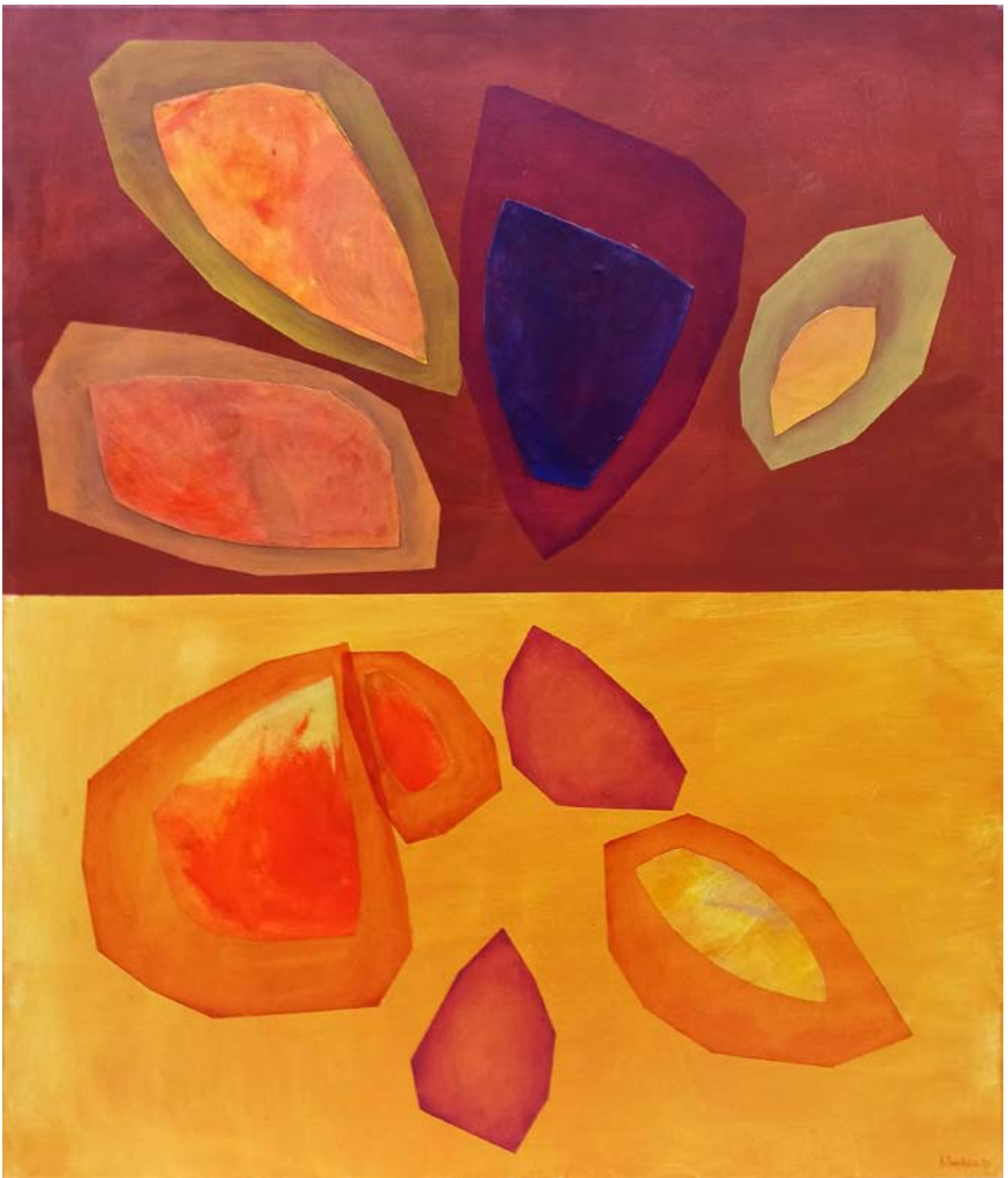
"Ziarna" 2023 acrylic on canvas 120/100 cm 48/40 in 6500 pln